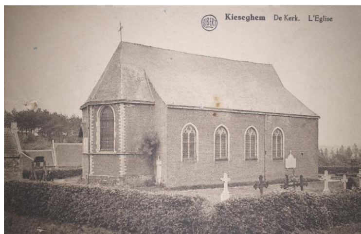
Kiezegem : kerk zonder de toren