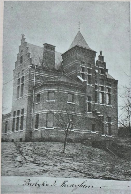
Buikhuys de Kiezeghem