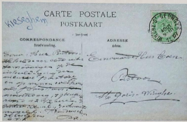
Uitnodiging per postkaart.