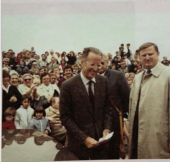
Koning Boudewijn op bezoek.

Meer gedetailleerde info over de geschiedenis en het erfgoed van beide dorpen kan je vinden op www.meensel-kiezegem.be .