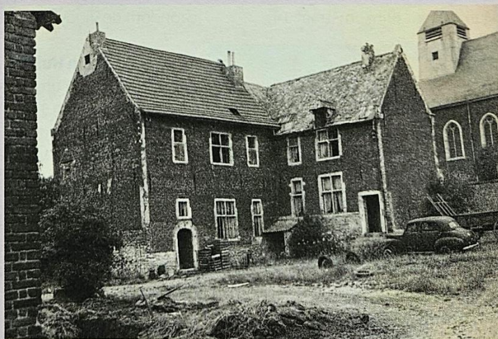
Het hof van Kieseghem in de jaren '60.