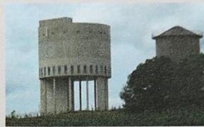
Jachttoren en watertorens.