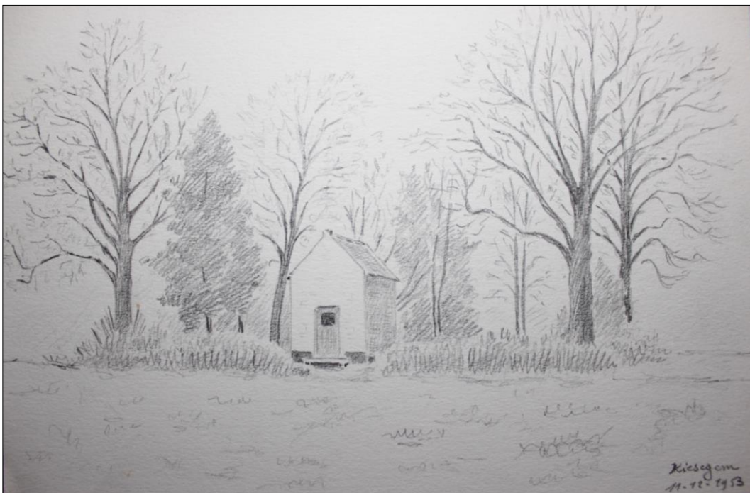
Tekening notaris Halfants – 11/12/1953

Achter het altaartje, blijkt op de muur een schildering te staan... dit laat vermoeden dat dit altaar er op een later tijdstip is geplaatst en dat het beeld vroeger op een voetstuk tegen de muur aanstond.