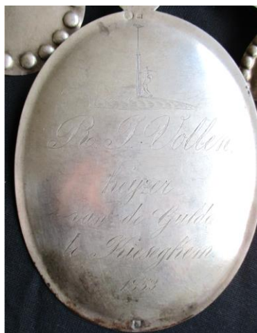
Ene met een heel mooie gedetailleerde tekening