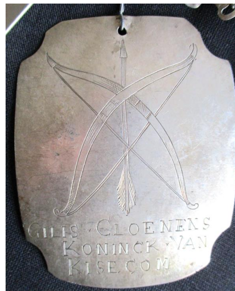
met een mooie tekening erop