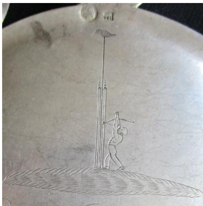
de oudste plakkaat.. 1663