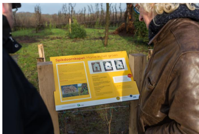
Het Infopaneel naast de kapel.