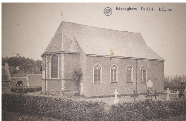
Kiezegem : kerk zonder de toren