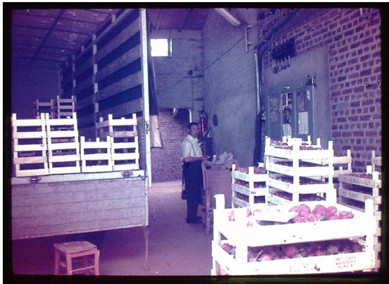
De broers René, getrouwd met Gerardine