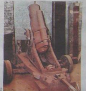
De Duitse mortier staat momenteel te roesten in de gemeenteloods.

"Het museum komt misschien in de pastorie", klinkt het. "Daar bevinden zich ook het erekerkhof van de oorlogsslachtoffers