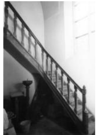
Het orgel wordt bereikt door een eiken trap, schrijnwerk van de periode 1791 tot 1800