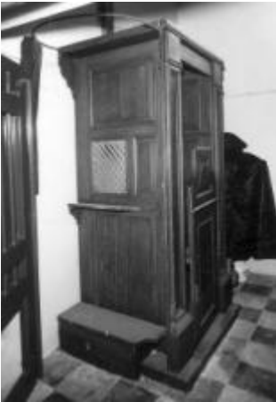
Biechtstoel voor de hardhorende

Deze werden vroeger ook gebruikt door de pater die maandelijks de biecht kwam horen.