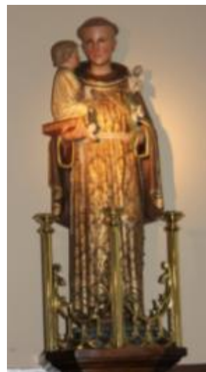
Antonius van Padua