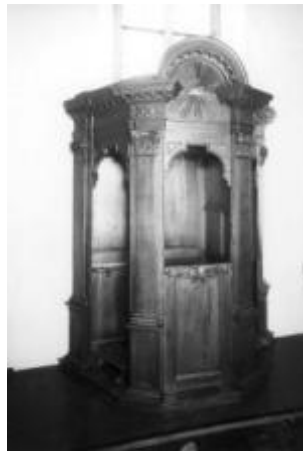
De gewone biechtstoel.