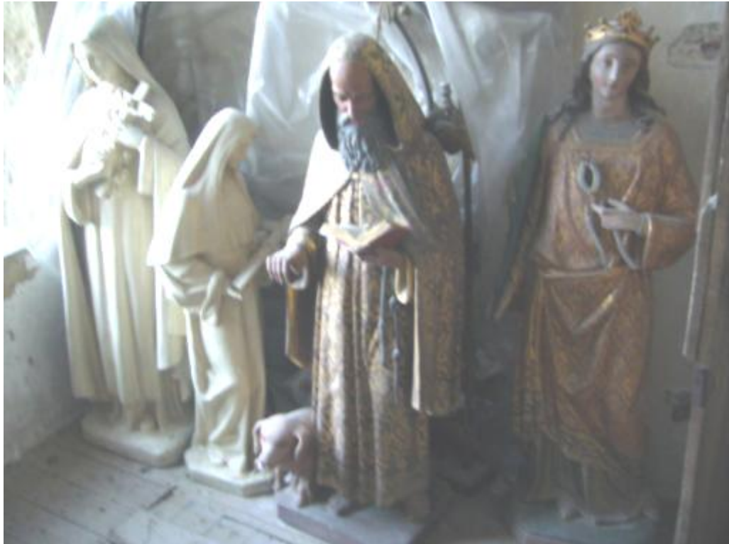
H. Rita - H. Theresia - St-Antonius, met varken - H. Apollonia met de tang