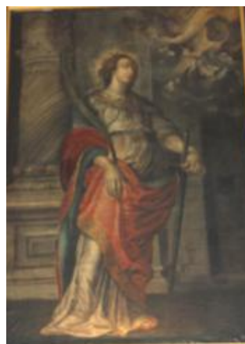
'Katharina van Alexandrië'

Boven het altaar hangt het houten trionfkruis met beelden van Maria en Johannes. De gepolychromeerde houten beelden zijn van de 16 de eeuw; het kruis is 19 de eeuws.