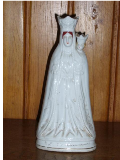
Beeld uit de vroegere kapel.