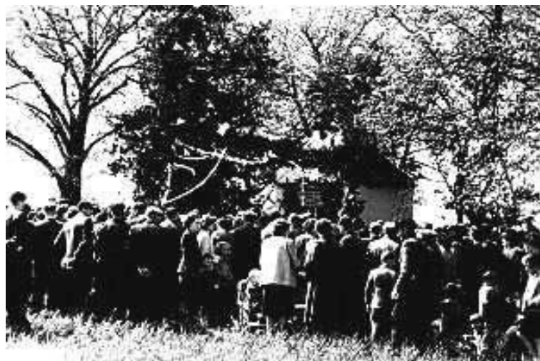
in de meimaand