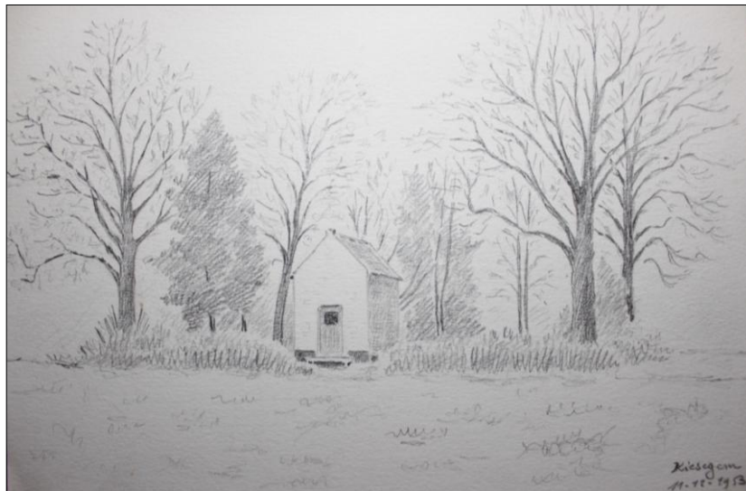
Tekening notaris Halfants – 11/12/1953

Achter het altaartje, blijkt op de muur een schildering te staan... dit laat vermoeden dat dit altaar er op een later tijdstip is geplaatst en dat het beeld vroeger op een voetstuk tegen de muur aanstond.